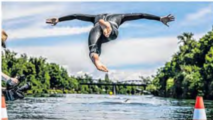
Ab in die Fluten der Traun

WELS. Es beginnt in der Traun. Dann folgen fünf Runden mit dem Rad durch die Stadt, bevor es zum Abschluss drei Mal durch den Burggarten, Stadtplatz und Ledererturm geht. Das sind die Zutaten des fünften Starlim City Triathlon Wels powered by Humer.