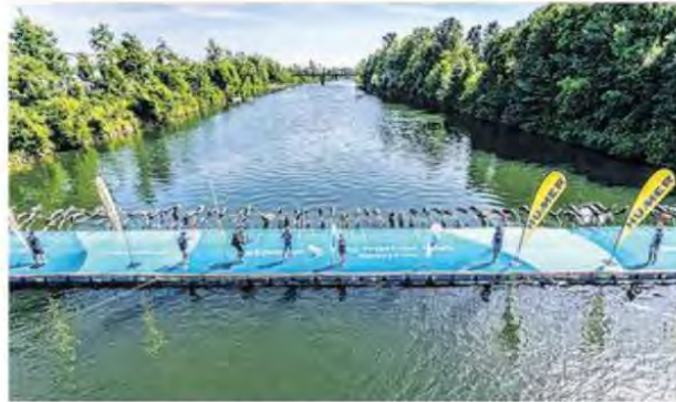
Der Start zum Triathlon erfolgt auf der Traun auf dem Steg.

Der 11. und 12. Juni steht ganz im Zeichen des Triathlonsportes. Die Distanzen sind 750 Meter Schwimmen, 20 Kilometer Radfahren und 5 Kilometer Laufen. 2022 wird wieder ein Europacup der Junioren ausgetragen und somit wird die internationale Elite der europäischen Youngsters erwartet. Aber nicht nur international, sondern auch national werden sich Mitte Juni