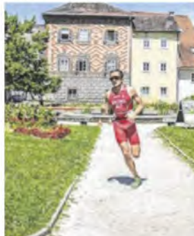
Durch die Stadt

WELS. Im kommenden Jahr wird die Stadt zur Triathlon Hauptstadt des Landes. Am 11. und 12. Juni finden nicht nur die Staatsmeisterschaften über die Sprintdistanz plus ein Open Race statt, sondern auch die besten Jugendlichen Europas werden sich auch wieder matchen. ■