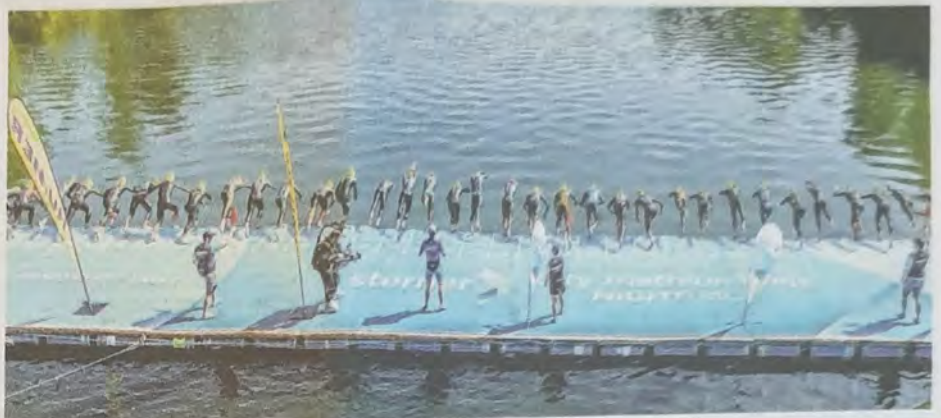
Rund 410 Triathletinnen und Triathleten stürzen sich heuer beim Welser starlim City Triathlon wieder vom Silberholz-Schwimmsteg.

Gestartet wird die Sportveranstaltung am Sparkassen-Start beim Silberholz-Schwimmsteg mit einem Sprung in die Traun. Nach der 750 Meter langen Schwimmstrecke geht es für die