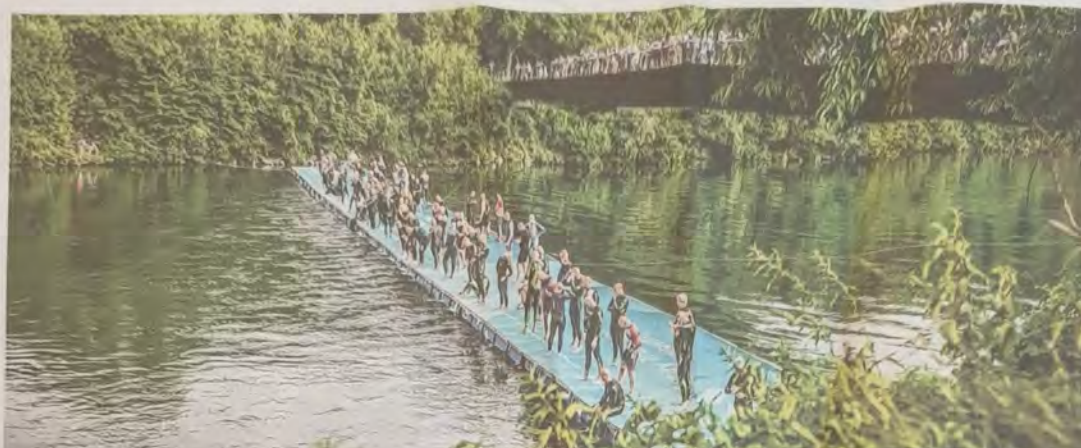
Die Triathletinnen und Triathleten gehen von der Startrampe in der Traun ins Rennen, geschwommen werden 750 Meter flussabwärts.